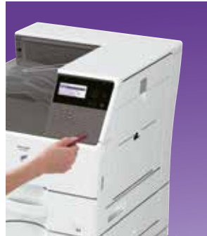
Puerto USB ubicado cómodamente

Seleccione una impresora de alto rendimiento para conseguir la productividad que necesita