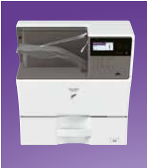
Compacta configuración de escritorio