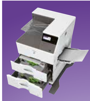
Capacidad de papel ampliable